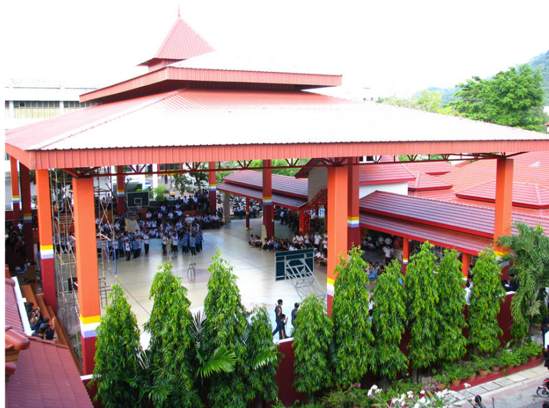
อาคารอยู่ดีมารักขนิม