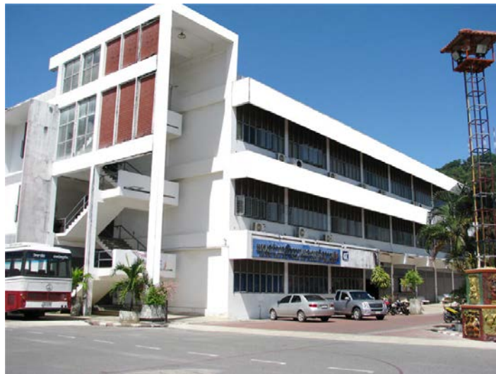
แผนกวิชาช่างกลโรงงาน