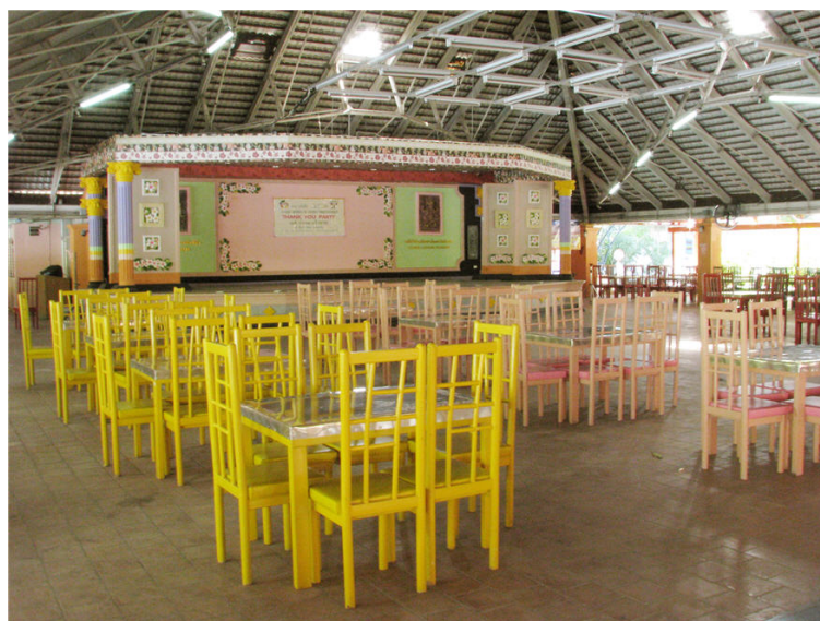
บริเวณภายในโรงอาหาร