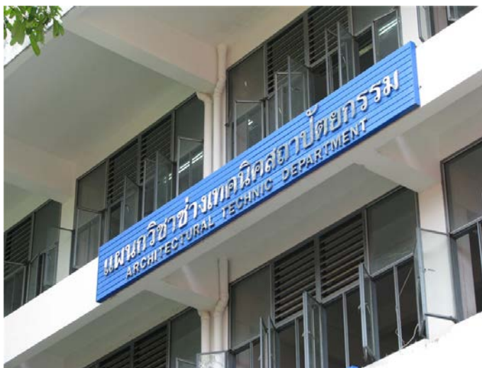
แผนกวิชาช่างเทคนิคสถาปัตยกรรม