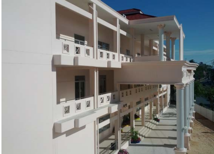
อาคารวิทยบริการและห้องสมุด