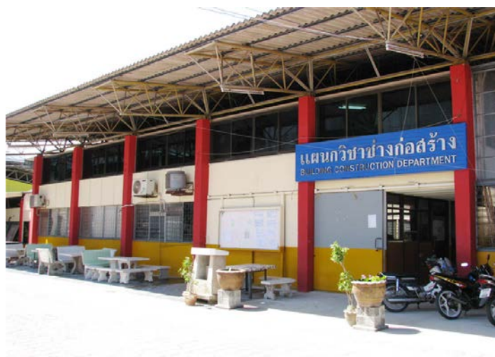
แผนกวิชาช่างก่อสร้าง