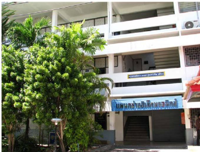
แผนกวิชาช่างอิเล็กทรอนิกส์