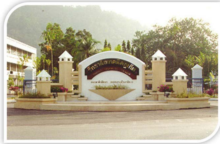
ป้ายวิทยาลัยเทคนิคภูเก็ต