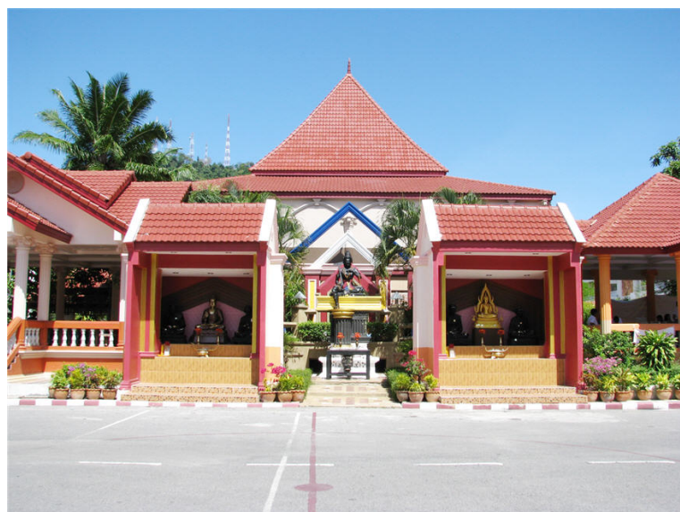
บริเวณลานหลวงปู่และพระวิษณุกรรม