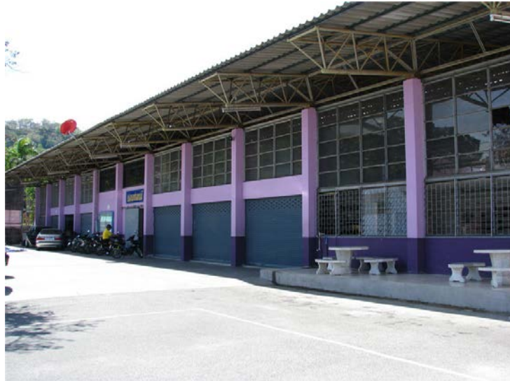
แผนกวิชาช่างยนต์