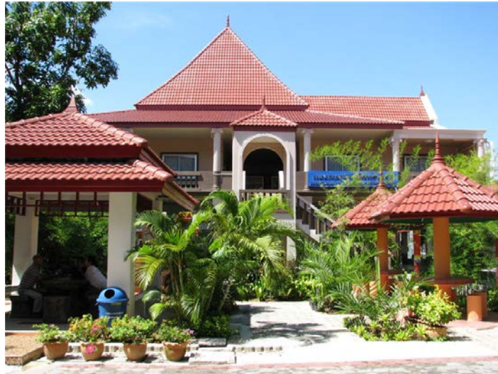
แผนกวิชาเทคโนโลยีสารสนเทศ