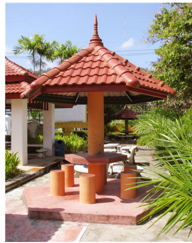
ศาลานั่งพักผ่อน