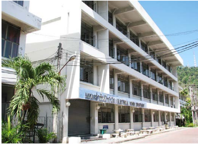
แผนกวิชาช่างไฟฟ้า