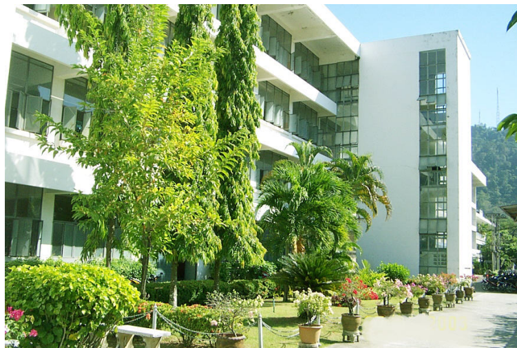
อาคาร 2 แผนกเทคนิควิศวกรรมหมืองแร่และสิ่งแวดล้อม และแผนกเทคนิคพื้นฐาน